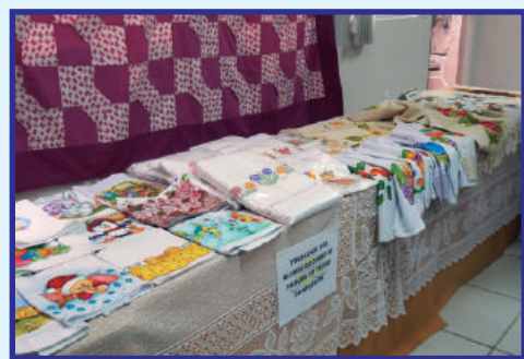
Pintura em Tecido