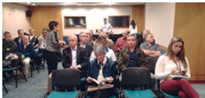
Representantes reunidos no Centro Empresarial Mourisco, PREVI - (RJ)

Levamos também nossas mensagens ao Seminário Regional da