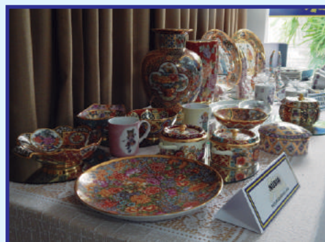
Pintura em Porcelana