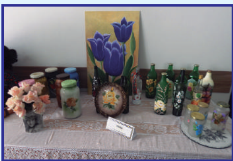
Pintura em Vidro e Madeira