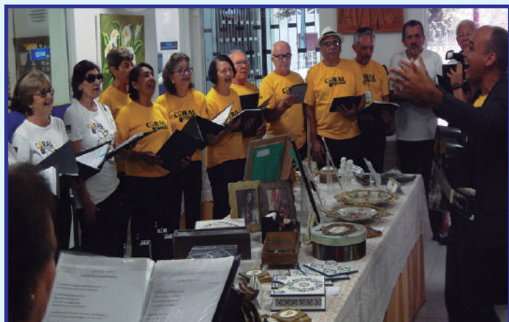
Abertura com apresentação do Coral "Vozes do Sol"

A arte é o ar que inspira a vida no espírito de cada pessoa. A Associação dos Funcionários Aposentados e Pensionistas do Banco do Brasil no Rio Grande do Norte - AFABB-RN, exaltando mais uma vez a arte, promoveu nos dias 20 e 21 de outubro, a sua 5ª Mostra de Talentos Artísticos da AFABB-RN.