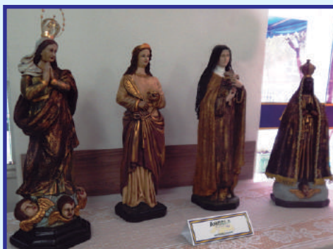
Restauração de Imagens Sacras