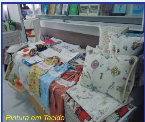
Pintura em Tecido