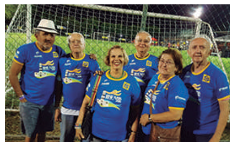
Equipe de Buraco - Medalhas de PRATA e de BRONZE.