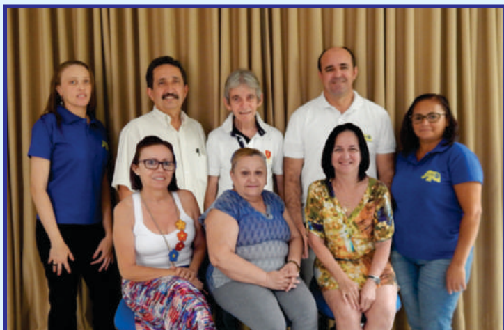
Equipe de organização e apoio