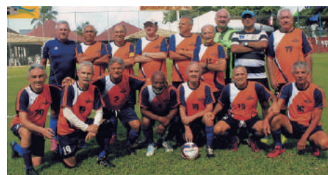
Futebol Hipermaster - Medalha de BRONZE.