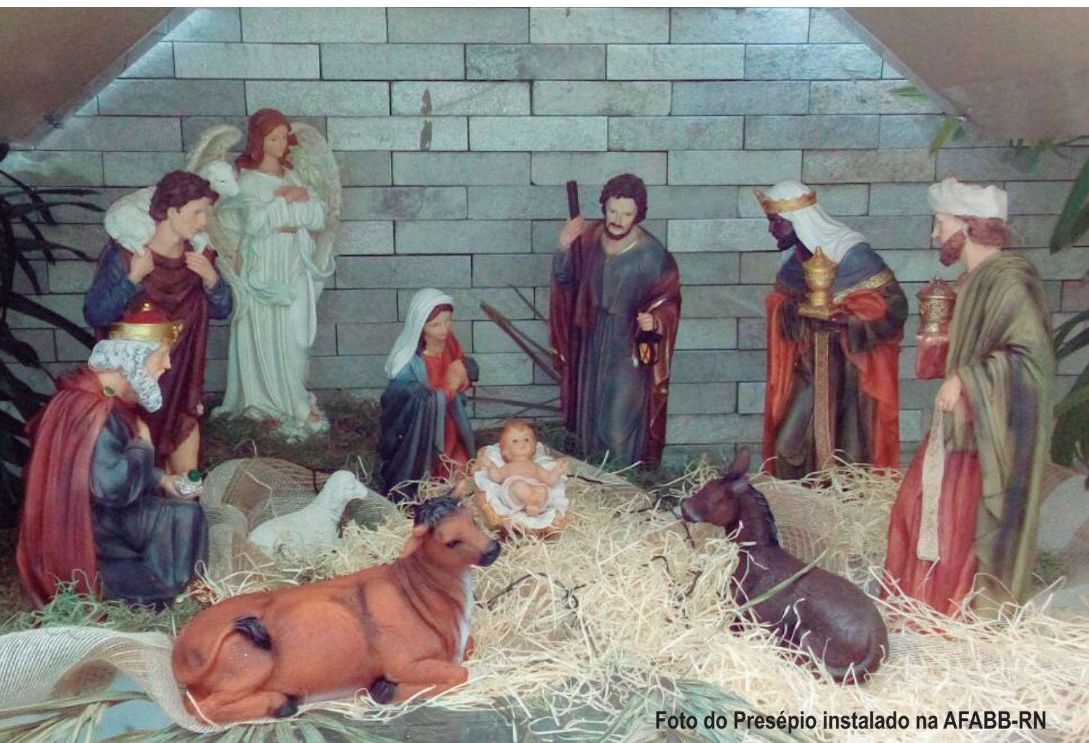
Foto do Presépio instalado na AFABB-RN