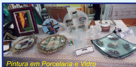
Pintura em Porcelana e Vidro