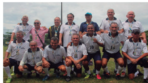
Futebol Supermaster - Medalha de OURO.