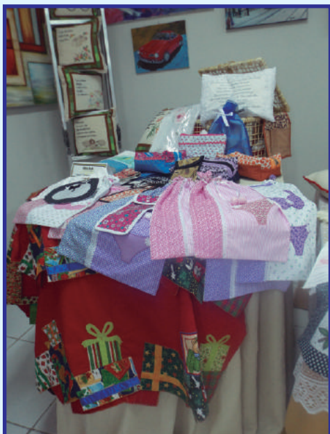
Bordado e Patchwork