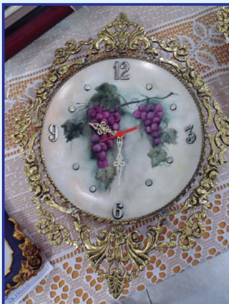
Pintura em Porcelana e Vidro