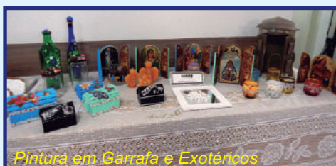
Pintura em Garrafa e Exotéricos