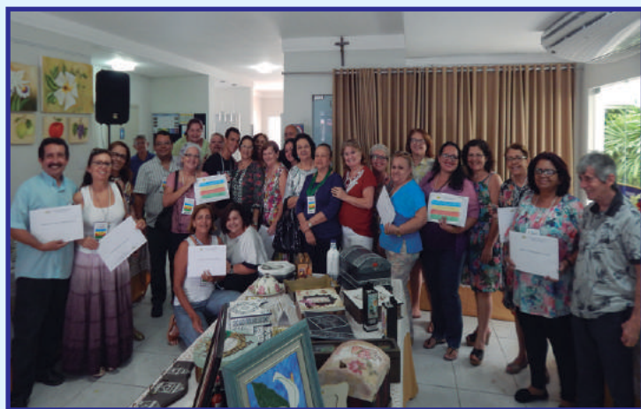
Encerramento e entrega de Certificados

A AFABB-RN agradece aos participantes da 5ª Mostra, e aguarda a presença e o talento de todos na próxima edição.