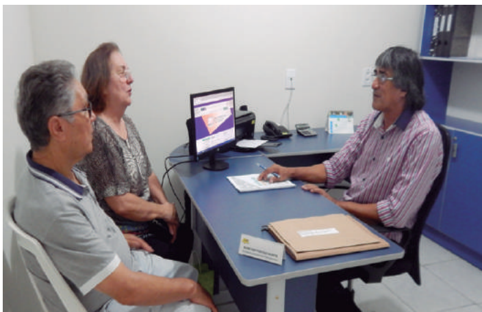
Assessoria Assistencial e Previdenciária

Por muitos anos, na década de 1970, os colegas aposentados se reuniam, diariamente, durante o expediente bancário, no segundo pavimento da Agência Centro Natal, no setor conhecido como “ Sala dos Aposentados ”, espaço gentilmente cedido pelos gestores daquela agência, em acordo com a Superintendência Regional do Banco. Vale lembrar que antes da disponibilidade da Sala, os aposentados se reuniam à sombra das árvores, no estacionamento do Banco, onde “jogavam conversa fora”, se inteiravam dos acontecimentos que lhes diziam respeito, numa “terapia” que, espontânea e naturalmente, mantinha unidos os laços de amizade, evitando o enfraquecimento da coletividade pela dispersão.