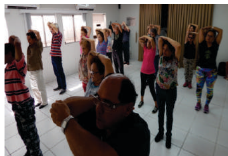
Turma de Aeróbica