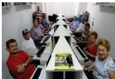
Curso de Informática