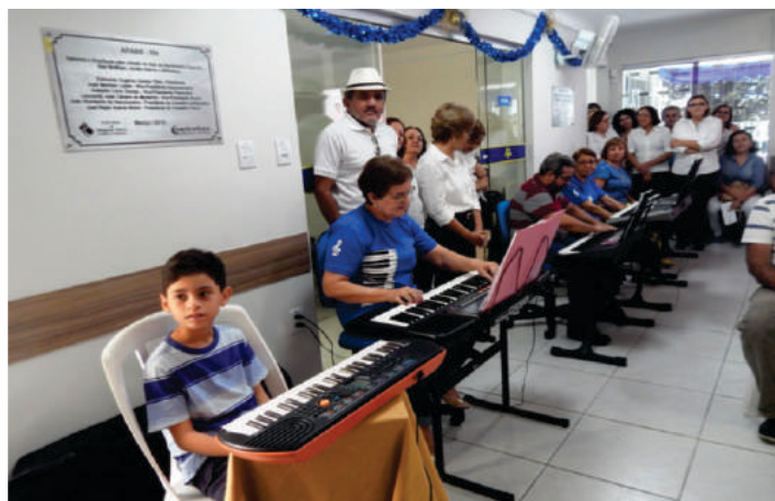
Curso de Teclado