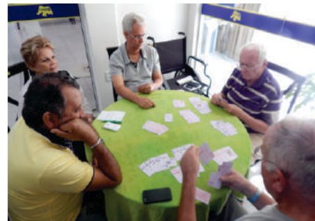
Jogos de Mesa – Baralho