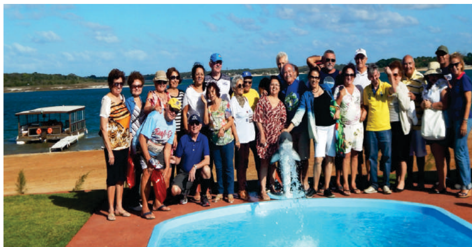
Passeio à Lagoa do Bonfim