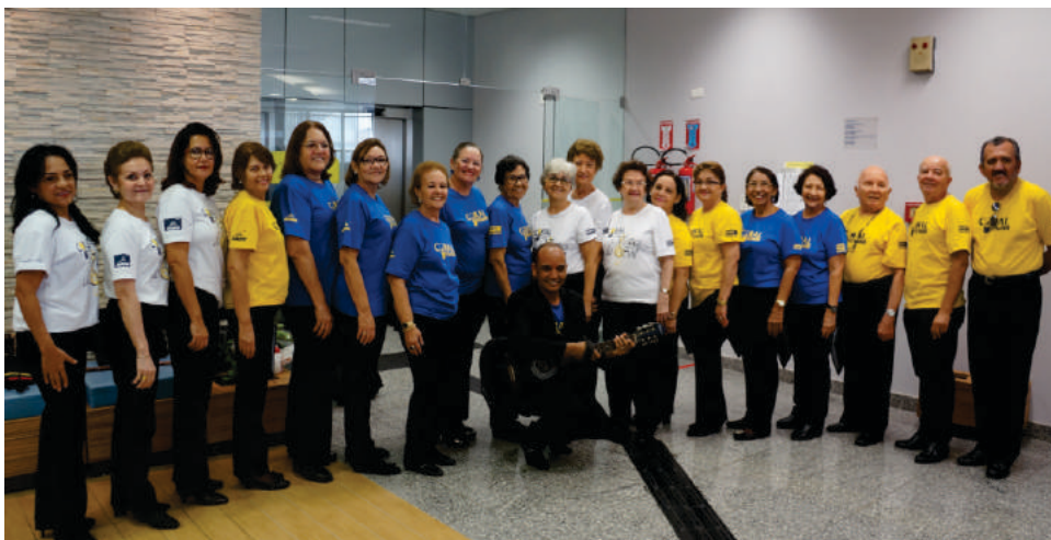
Coral “Vozes do Sol”