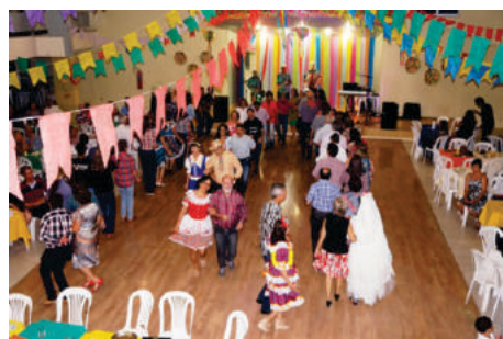
Arraiá da AFABB-RN