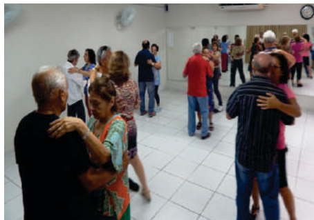
Curso de Dança de Salão