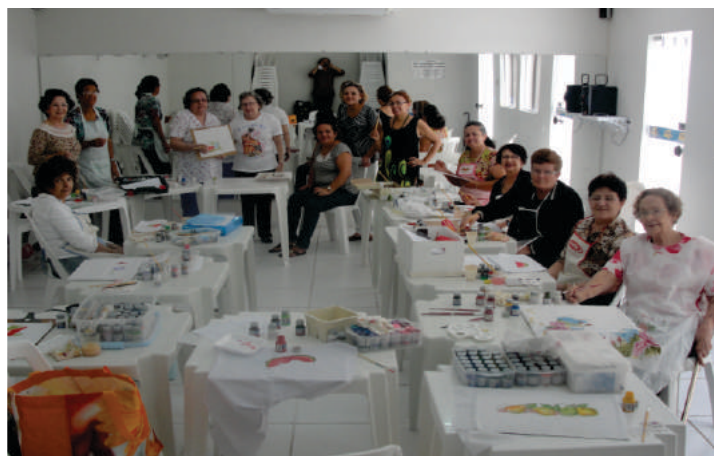
Curso de Pintura em Tecido