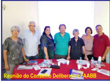
Reunião do Conselho Deliberativo FAABB