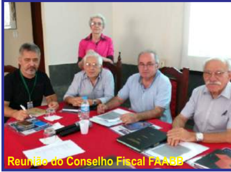
Reunião do Conselho Fiscal FAABB

Promovido pela Federação das Associações de Aposentados e Pensionistas, foi realizado, nos dias 11 e 12 de abril de 2018, o Encontro Nacional das AFABBS de todo o Brasil, na sede campestre da AAFBB, localizada em Xerém (RJ).