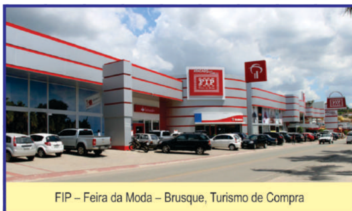
FIP – Feira da Moda – Brusque, Turismo de Compra