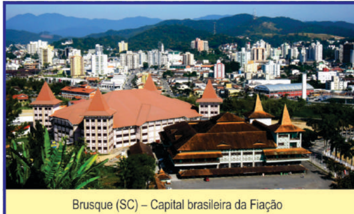
Brusque (SC) – Capital brasileira da Fiação