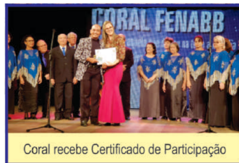
Coral recebe Certificado de Participação