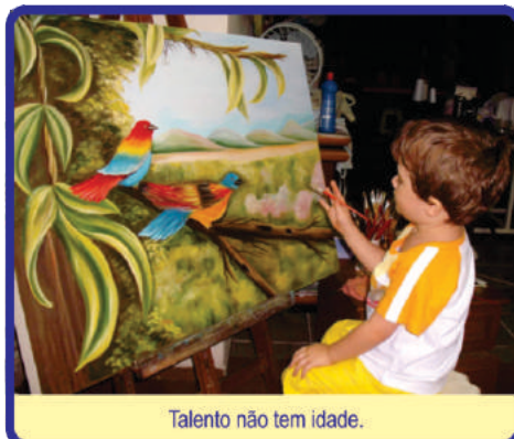
Talento não tem idade.