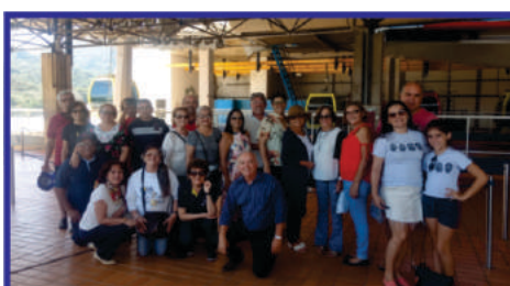
Balneário Camboriú – Embarque no Teleférico