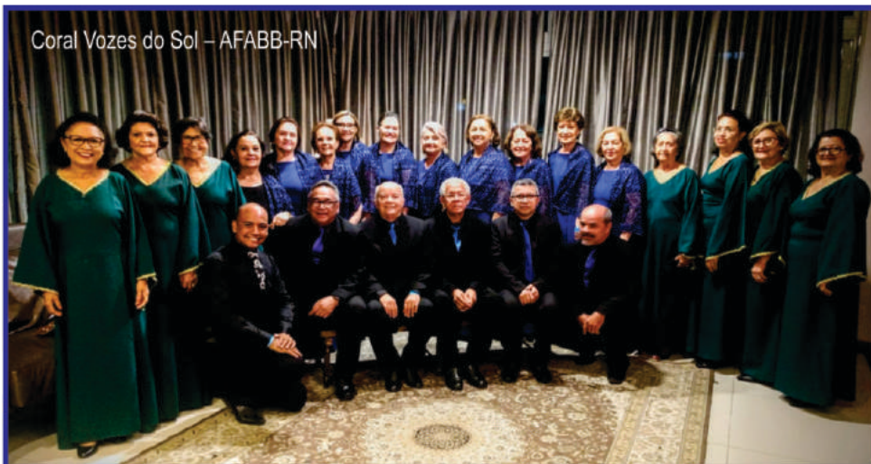
Coral Vozes do Sol – AFABB-RN