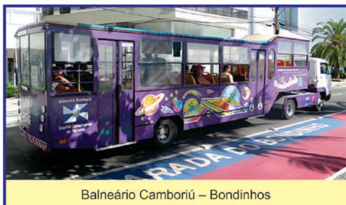
Balneário Camboriú – Bondinhos