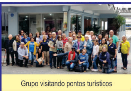
Grupo visitando pontos turísticos