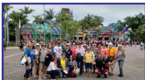
Beto Carrero – Momento de Lazer

Beto Carrero World é um parque temático localizado no município de Penha, a 35 km do Balneário Camboriú, situado no litoral norte do estado de Santa Catarina. Inaugurado no dia 28 de dezembro de 1991, pelo seu idealizador João Batista Sérgio Murad, artística-