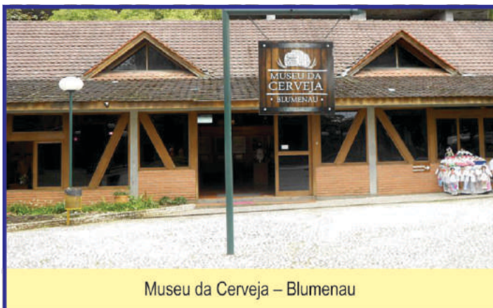
Museu da Cerveja – Blumenau