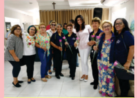
Elas por Elas

O Dia Internacional da Mulher é comemorado no dia 08 de Março desde o ano de 1975, data instituída pela ONU. Atualmente, é comemorado em mais de 100 países como um dia para lembrar os protestos por direitos e para exaltar a celebração feminina.