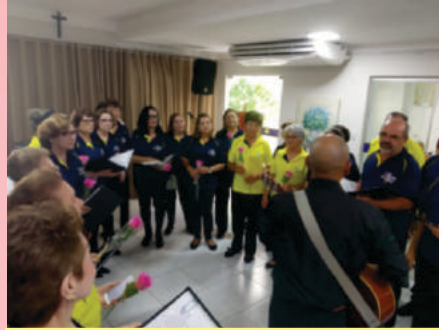
Coral 'Vozes do Sol'