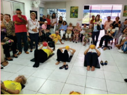
Demonstração de Pilates